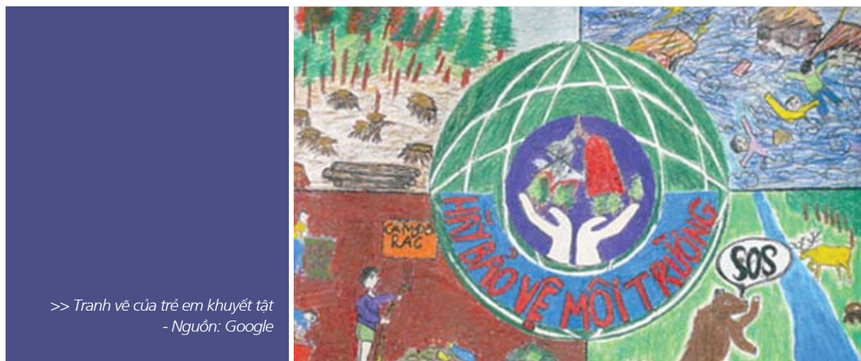
>> Tranh vẽ của trẻ em khuyết tật - Nguồn: Google