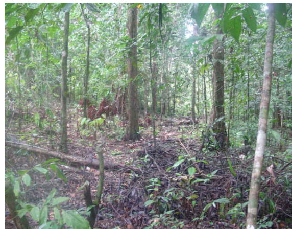
Gambar 2. Kampung Lama Situs Huhule, Desa Tuhaha, Kec. Pulau Saparua, Kab. Maluku Tengah, Propinsi Maluku

satu kesatuan yang utuh. Sebab hubungan keduanya bersifat temporal parsial (Koentjaraningrat, 1987 : 172-184).