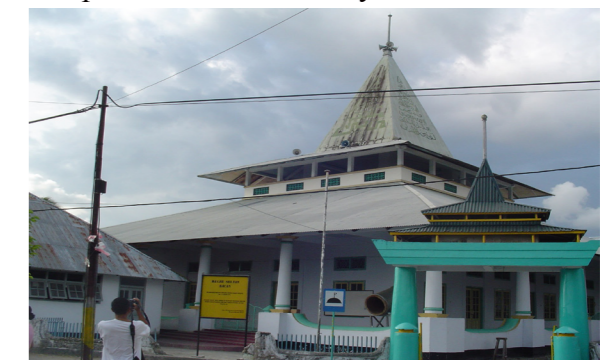
Gambar 7. Mesjid di Pulau Bacan, Propinsi Maluku Utara

Dolmen, menhir, negeri lama/ permukiman lama bagian integral dari sebuah sistem sosial budaya. Ketiga tinggalan arkeologis ini sangat erat kaitannya dengan masyarakat adat di Kepulauan Maluku. Seperti yang telah dijelaskan sebelumnya sifat ketiga tinggalan arkeologi ini temporal parsial (saling keterkaitan antara satu dengan yang lain). Mesjid dan gereja tua , secara eksplisit melambangkan kekuasaan pada waktu itu serta perkembangan masyarakat dari fase ke fase. Masjid identik dengan Islam , seperti yang kita ketahui bahwa perkembangan Islam di Indonesia umumnya dan Kepulauan Maluku khususnya telah berlangsung abad-abad lamanya sebelum masuknya bangsa penjajah (gereja). Pada dasarnya Islam di Maluku, dapat ditelusuri dengan tinggalan-tinggalan arkeologis, diantaranya arsitektur, pola sebaran, ajarannya dan budaya tutur atau etnografi (Handoko, 2011 : 27- 40). Interpretasi makna dari tinggalan arkeologi telah memaknai substansi nilai, norma, falsafah dan bahkan seluruh aspek sosial budaya didalamnya. Implikasi pemaknaan tinggalan arkeologi adalah tidak lain memberikan gambaran perspektif terhadap umat manusia (masyarakat) bahwa konstruksi awal peradaban manusia memang seperti ini, dan untuk itu diperlukan pemahaman dan penelusuran lebih atas gagasan-gagasan, dan ide kebudayaan. Budaya benda bendawi tinggalan arkeologi Islam sebagai representasi pemaknaan simbol daripada nilai sosial budaya manusia.