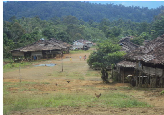
Gambar 5. Permukiman Tradisional Orang Huaulu di Seram Utara, Kabupaten Maluku Tengah Propinsi Maluku

tradisional orang Huaulu dan Nuaulu di Pulau Seram. Sistem nilai budaya mereka sangat terjaga dengan baik, sehingga nilai sosial budaya masih terpelihara sekalipun dinamika perkembangan dunia tetap jalan seiring waktu. Untuk konteks kedua, tinggalan arkeologi memang dipandang sebagai sesuatu benda mati, tetapi nilai dibalik benda mati itu sendiri sangat besar bagi kepentingan makhluk hidup Maluku ke masa-masa mendatang dan Indonesia umumnya.