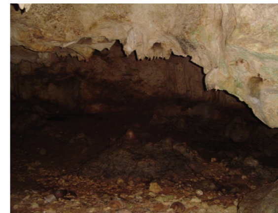
Gambar 6. Gua prasejarah Hatuurang Negeri Hatusua, Kab. Seram Bagian Barat, Propinsi Maluku

Contoh lain, situs Gua Hatuurang yang berada di daerah Pulau Seram Bagian Barat, tepatnya di Desa Hatusua. Menurut budaya tutur masyarakat setempat bahwa dulu Hatuurang adalah lokasi kompleks manusia Seram Barat bermukim. Dari sisi arkeologi situs Hatuurang memang sangat komperhensif untuk menetap. Karena dekat dengan sumber bahan makanan, dan dekat juga laut. Oleh Soejono mengatakan bahwa manusia prasejarah, khususnya Plestosen akhir sampai awal Holosen, dalam mempertahankan hidupnya masih bergantung pada ketersediaan lingkungan alam sekitarnya. Di Asia Tenggara, kehidupan gua ( cave ) atau ceruk ( Rock shelter ) mencapai puncaknya pada kala Holosen. Dikatakan lanjut oleh Heekeren dalam memanfaatkan gua/ceruk sebagai tempat tinggal, manusia saat itu telah mempertimbangkan masak-masak. Tidak semua gua atau ceruk dimanfaatkan sebagai tempat tinggal (tempat bermukim). Dari aspek keletakan, manusia saat itu cenderung memilih lokasi gua atau ceruk pada daerah-daerah yang menyediakan kebutuhan pokok, seperti sumber bahan makanan aquatic atau non aquatic yang dianggap menguntungkan dari segi subsistensinya (Asikin, 2012: 1).