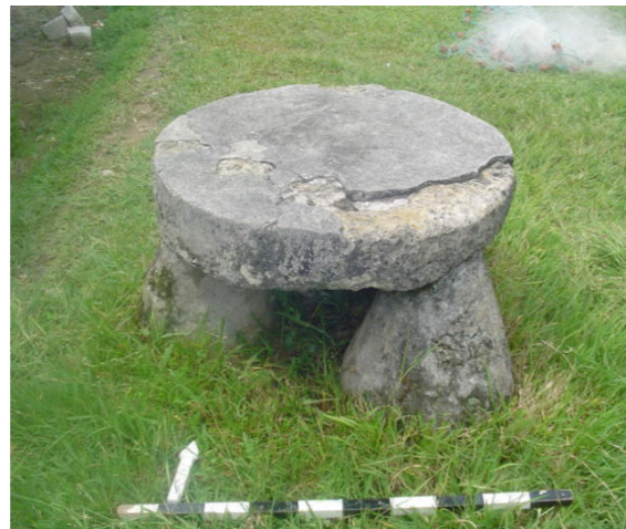
Gambar 3. Dolmen Batu Meja, Desa Nolloth, Kec. Pulau Saparua, Kab. Maluku Tengah, Propinsi Maluku

Pemukiman lama/negeri lama dan dolmen (batu meja) , bagi masyarakat Maluku, khususnya Maluku Tengah sangat erat kaitannya. Setiap akan melakukan acara pelantikan Raja, calon Raja harus mengunjungi negeri lama untuk bermalam disana batawana dan melakukan tarian maku-maku . Tujuan daripada hal tersebut adalah tidak lain untuk memperkenalkan calon raja kepada para leluhur, dengan maksud agar calon raja dapat memimpin negeri/desa dengan baik, jujur dan tidak sembarangan. Oleh Sunarningsih disebutkan bahwa manusia adalah makhluk individu bergantung pada alam sekitar atau lingkungan. Sebagai makhluk manusia bergantung pada manusia lainnya untuk memenuhi kebutuhan hidupnya. Kedua sifat manusia tersebut menyebabkan dalam kehidupan lebih memilih untuk hidup berkelompok, pada akhirnya manusia dapat menguasai teknologi pembuatan tempat tinggal dan dimulainya kehidupan menetap. Oleh sebab itu hubungan manusia dengan alam direpresentasikan lewat tradisi-tradisi berlanjut, dimana batu meja dolmen dijadikan sebagai benda bendawi dipergunakan dari masa ke masa (Latifundia, 2007 : 25).