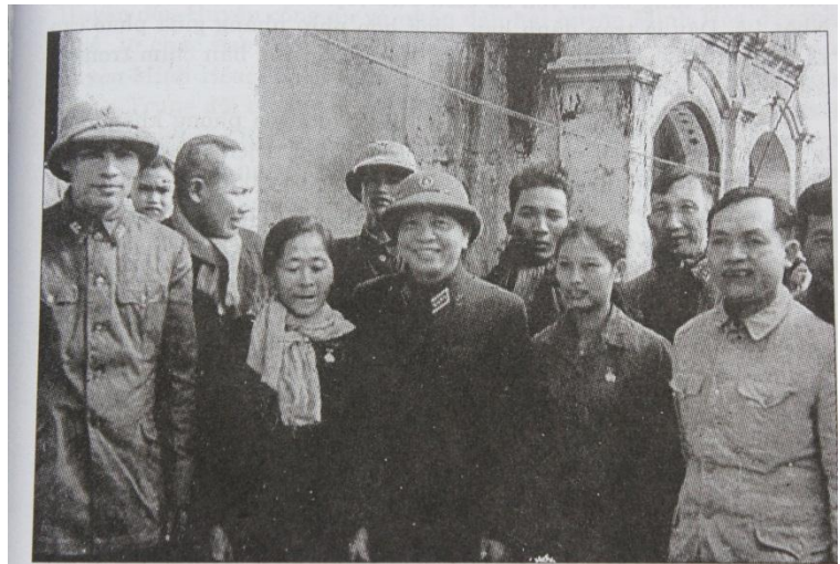
Đại tướng Võ Nguyên Giáp thăm cán bộ, chiến sĩ lực lượng vũ trang Quảng Bình

Sự quan tâm, gần gũi, chân tình của Đại tướng đã in sâu trong tâm trí bao người. Không chỉ với bộ đội, mà cả thanh niên xung phong, dân quân, du kích, dân công hỏa tuyến... trên khắp các chiến trường. Còn nhớ, giữa những ngày tháng 3 ác liệt của năm 1973, trong một chuyến thăm bộ đội Trường Sơn, Đại tướng ghé lại thăm một đơn vị tại đèo Phu La Nhích. Đại tướng rất xúc động và