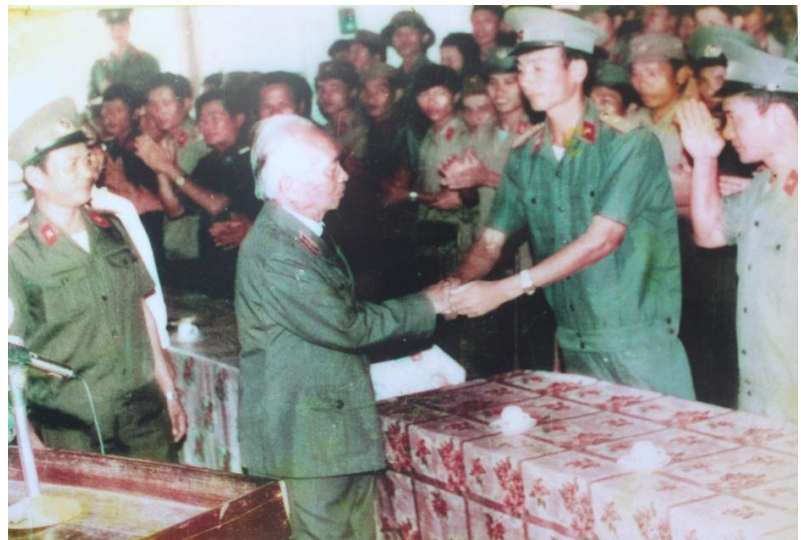
Đại tướng Võ Nguyên Giáp thăm cán bộ, chiến sĩ lực lượng vũ trang Quảng Bình, tháng 2 năm 1990